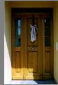
Einfamilienhaus - Bergtheim - 1997 Holzfenster, Stil-Eingangstüre und Fensterläden