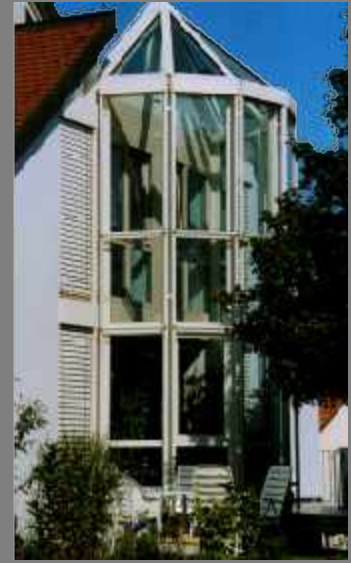
Wintergärten - Würzburg - 1998 Wintergärten aus Holz mit Holz-Aluminium Dachverglasung