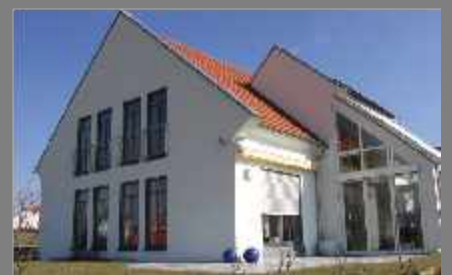
Einfamilienhaus - 2007

Holzfenster, Wintergarten und Sonnenschutz