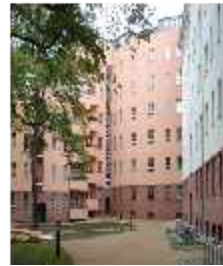
Wohnanlage Gartenstadt - Berlin - 2001 bis 2005 Denkmalschutzfenster Holz, mit Schallschutzanforderung