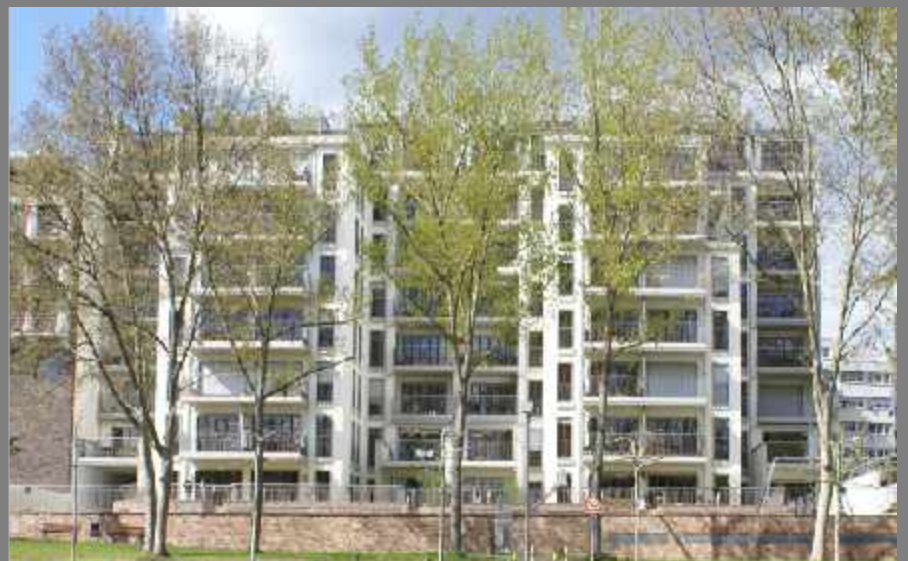
Eigentumswohnanlage - Frankfurt - 2007 Holzfenster, Eingangstüren