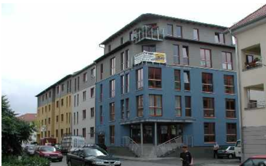
Familienhof Connewitz - Leipzig - 1999 Fenster und Eingangstüren aus Holz