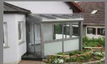
Terassendach mit Vertikalverglasung -Üngershausen - 2008 Glashaus und Sonnenschutz