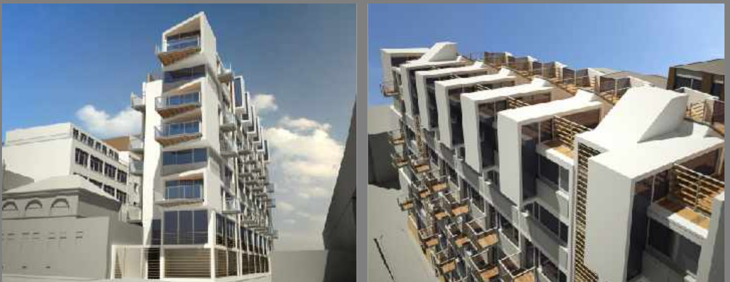
Eigentumswohnungen und Gewerbeeinheiten- London - 2008/09

Holz-Aluminium-Fenster mit Einbruchhemmung und Alarmanlage