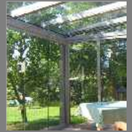
Terasse - 2008 Glashaus, Ganzglasfaltanlagen mit Aluminium Terrassendach