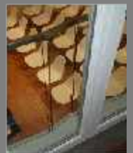
Lichtburg Forum Gartenstadt- Berlin - 2003 Fenster Holz,, Schallschutz und Absturzsicherung