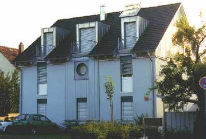
Bürogebäude - Würzburg - 1996 Holzfenster, Eingangstüre und Sonnenschutz