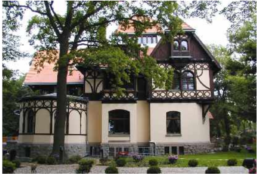
Denkmalgeschützte Mehrfamilienhäuser - Leipzig und Markkleeberg Holzfenster und Eingangstüren