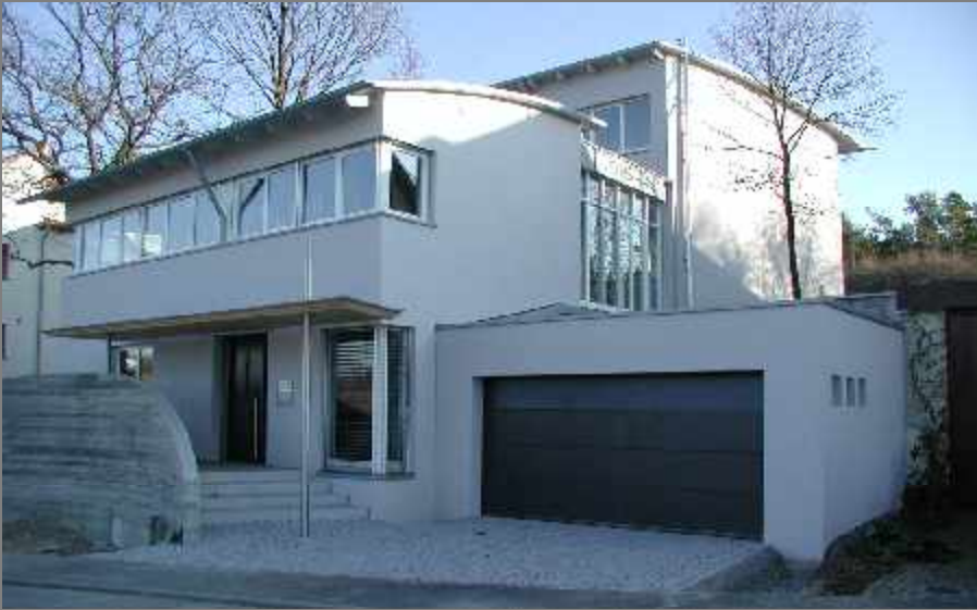
Einfamilienhaus mit Bürogebäude - 1999 Holzfenster, Design-Eingangstüre und Sonnenschutz