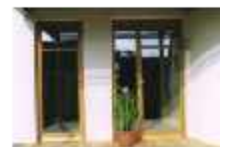
Einfamilienhaus - 1997 Holzfenster, Eingangstüre und Rollläden