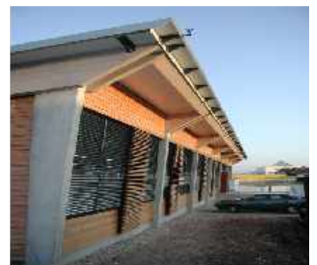
Gewerbebau - Würzburg - 2002 Pfosten-Riegel-Fassade mit Eingangstürelement