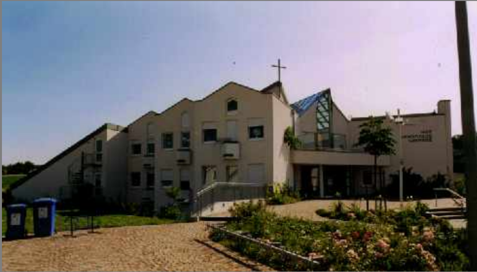
Evangelisches Gemeindezentrum - Würzburg Holzfenster und Eingangstüren