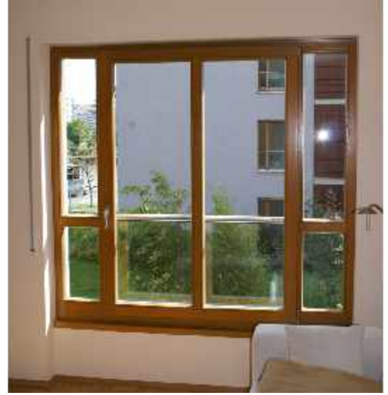
Eigentumswohnanlage -Frankfurt - 2003 Holzfenster und Holzschiebeläden