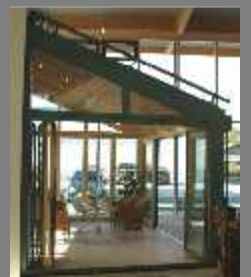
Wintergarten-Ausstellung Mittnacht - Würzburg - 2007 Wintergärten in Aluminium und Holz-Aluminium und als Glashauss