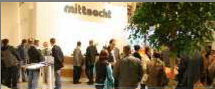
Eröffnung der Ausstellung