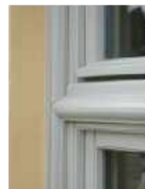
Seniorenstift Bürgerspital Eehaltenhaus - Würzburg Denkmalschutzfenster aus Holz