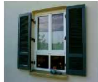
Einfamilienhaus - 1996 Holzfenster, Eingangstüre und Fensterläden