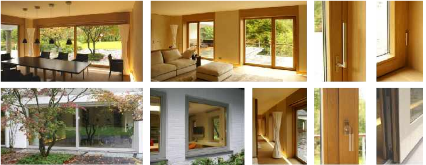
Einfamilienhaus - Düsseldorf - 2008

Holz-Aluminium-Fenster mit Einbruchhemmung und Alarmanlage