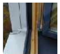
Hochschule für Musik - Würzburg - 2007 Hochschalldämmende Holz-Aluminium-Kastenfenster