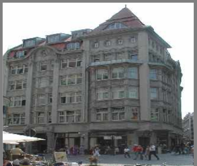
Denkmalgeschützte Mehrfamilienhäuser - Leipzig Holzfenster, Eingangstüren und Schaufensteranlagen