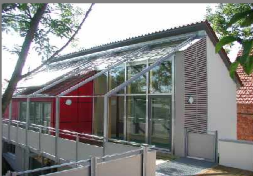
Einfamilienhaus Holzfenster, Eingangstüre, Pfosten-Riegel-Fassade und Sonnenschutz