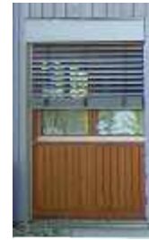
Einfamilienhaus - Rimpar - 1998 Holzfenster, Eingangstüren und Sonnenschutz