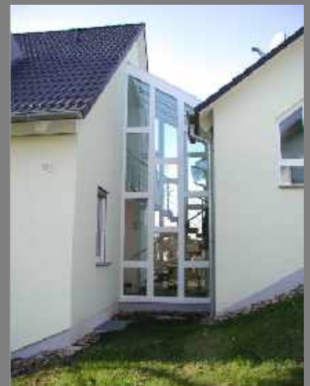
Einfamilienhaus -1999 Holzfenster, Eingangstüre und Wintergarten