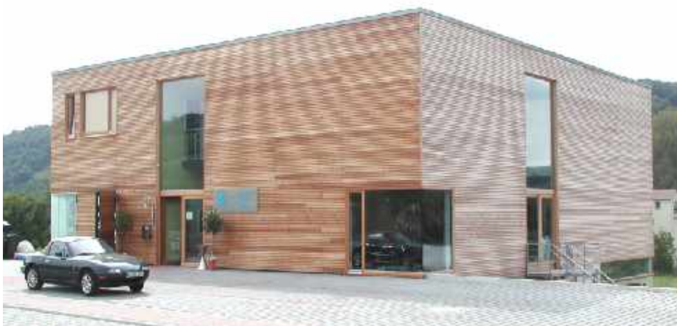
Ausstellungsbau - Sommerhausen - 2001 Holzfenster, Eingangstürelement und Eckverglasungen