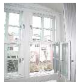
Amt für ländliche Entwicklung - Würzburg - 2002 Kastenfenster aus Holz