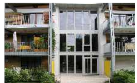
Wohnanlage "Untere Au" - Veitshöchheim - 2003 Holzfenster und Eingangstüren seniorengerecht