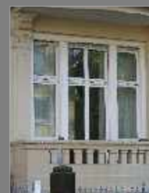
Mehrfamilienhaus - Frankfurt - 2003 Denkmalschutzfenster Holz mit Einbruchhemmung