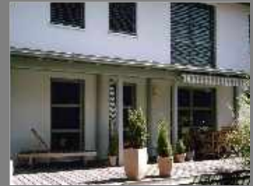
Einfamilienhaus - Poppenlauer - 2003 Holzfenster, Eingangstüre, Sonnen- und Insektenschutz