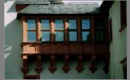
Museum Festung Marienberg - Würzburg Denkmalschutzfenster, aus Holz mit Einbruchhemmung und Alarmgebung