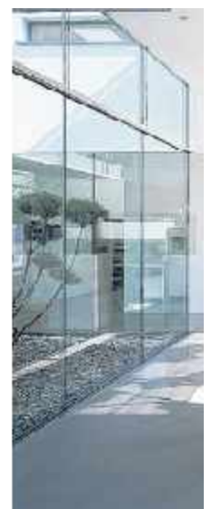
Einfamilienhaus - Würzburg - 2003 Holzfenster, Eingangstüre aus Holz. Glas-Atrium