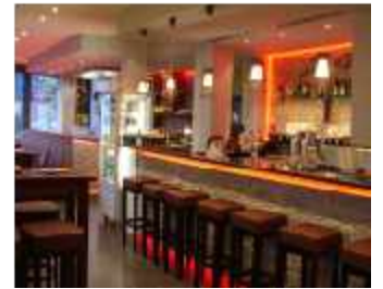
Cafe Restaurant Bar - Schweinfurt - 2008

Faltanlagen und Eingangstüre aus Aluminium und Sonnenschutz