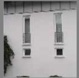
Einfamilienhaus - 1999 Holzfenster, Eingangstüre aus Holz-Aluminium