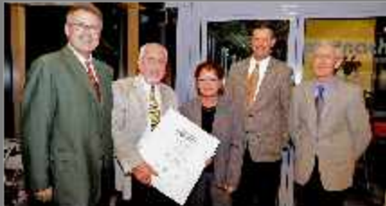
40 jähriges Jubiläum