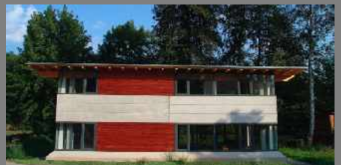
Bürogebäude - Partenstein - 2004 Holzfenster, Eckverglasungen und Eingangstüren